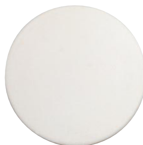
吸水コースター丸形 オフホワイト ●Sサイズ :88mm φ