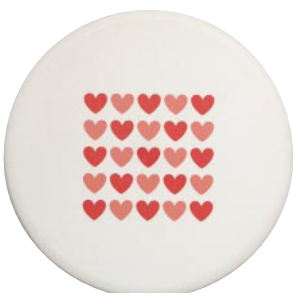
吸水コースター丸形 ハート ●Sサイズ :88mm φ