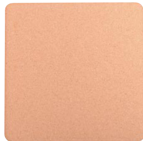
吸水コースター 角形 ●Sサイズ :88×88mm