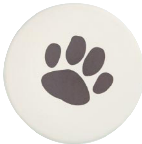
吸水コースター丸形 フットマーク ●Sサイズ :88mm φ