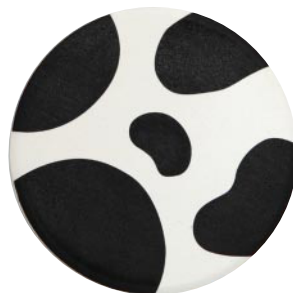
吸水コースター丸形 ホルスタイン ●Sサイズ :88mm φ