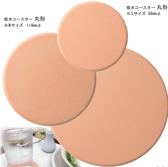
吸水コースター 丸形 ●Sサイズ :88mm φ