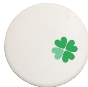
吸水コースター丸形 クローバー ●Sサイズ :88mm φ