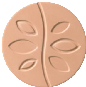
吸水コースター丸形 リーフ ●Sサイズ :88mm φ