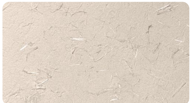
●ワラ入り ※ワラは別途ご用意頂き、現場で混合してください。

※その他のテクスチャーに関しては、お問い合わせください。手作業で仕上げる材料のため、パターンは必ずしも均一にはなりません。