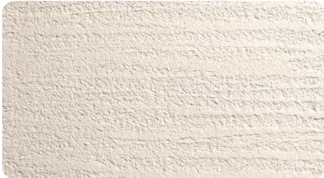
●ナチュラルウェーブ