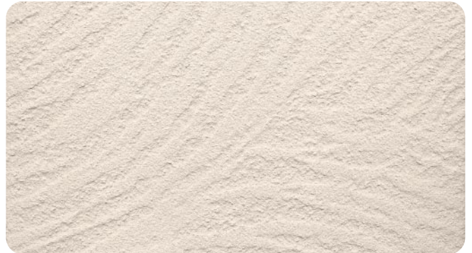
●ランダムウェーブ