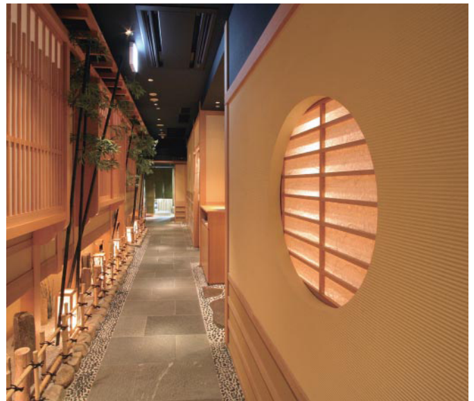
リターナブルパウダーA (エース) 施工例