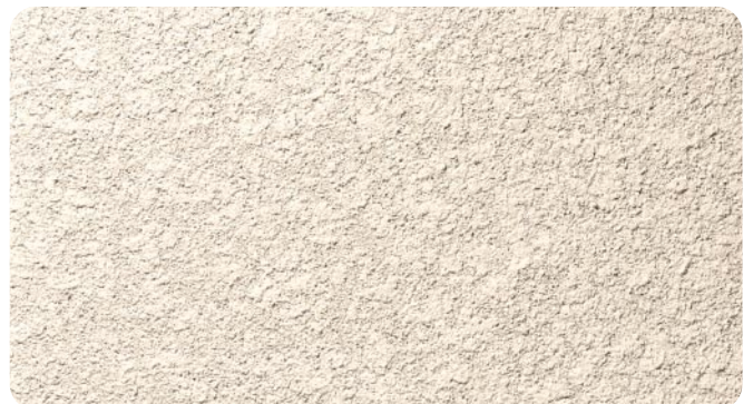
●吹付 ※リターナブルパウダー郷土では吹付仕上はできません。