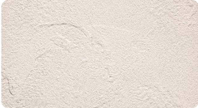
●ナチュラルストーム